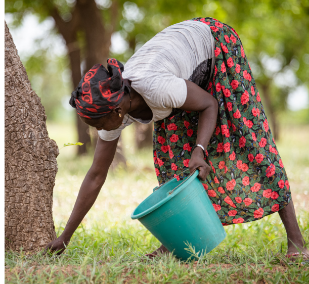
Happys mor samler shea-nødder. Shea-træet gror vildt og kan blive 400 år gammelt.