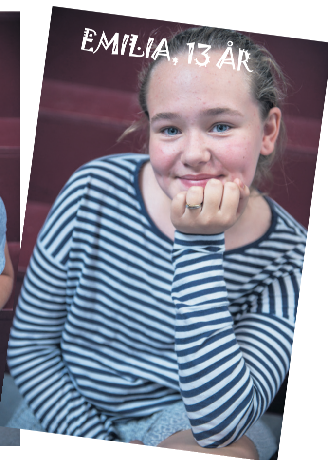
EMILIA, 13 ÅR