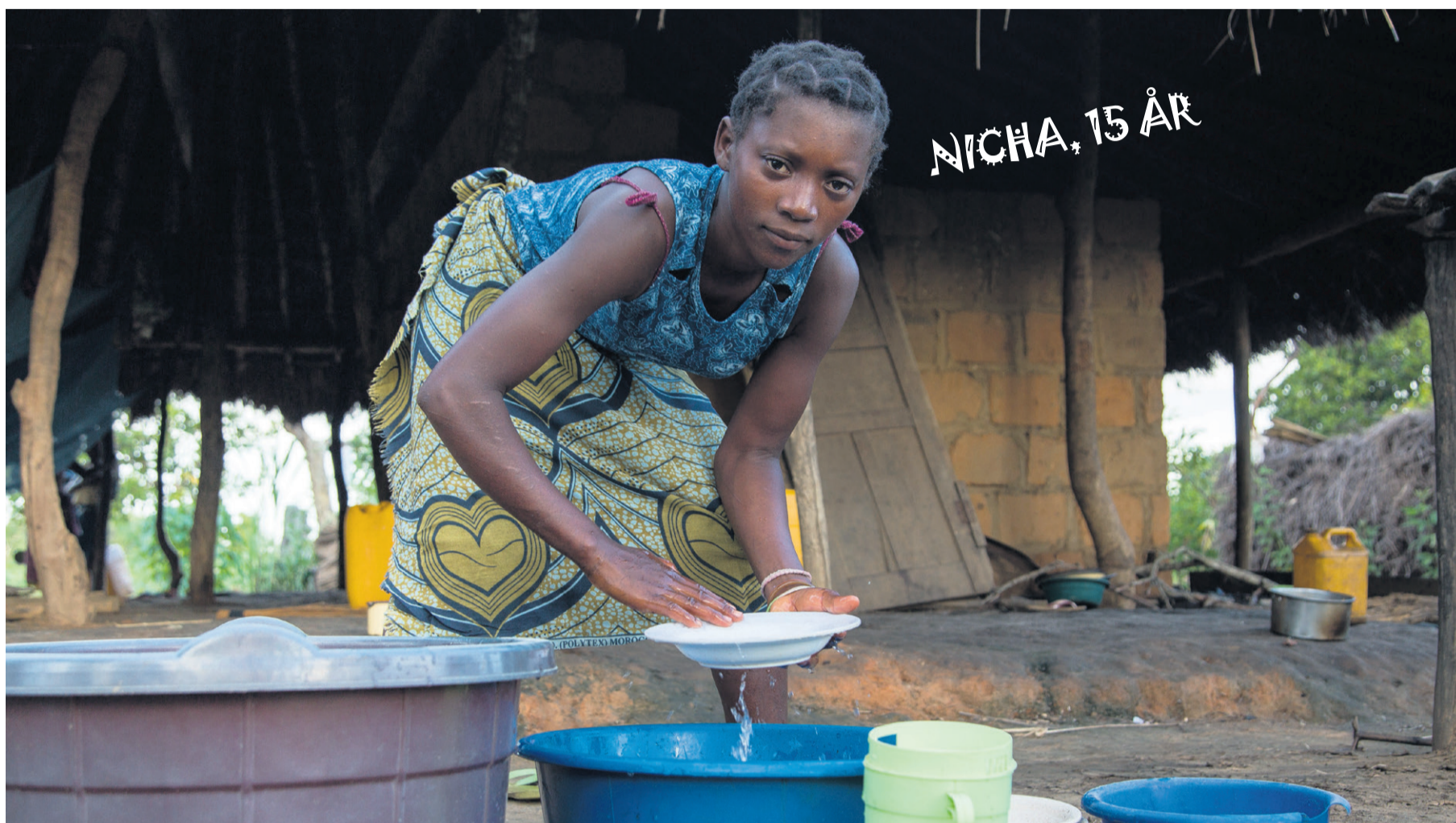
NICHA, 15 ÅR